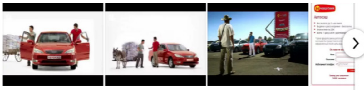
Рисунок 4 - Использование storytelling в рекламе Каспий Банка [10]

4. Storytelling использует в своей рекламе и Kaspi bank. Это и Автокэш, и серия рекламных роликов депозитов Kaspi bank, и другое.