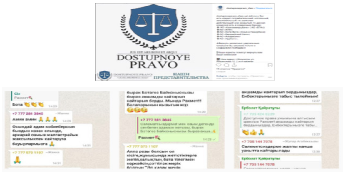
Рисунок 2 - Использование storytelling в рекламе Ассоциации «Доступное право» [8]

2. Ассоциация «Доступное право» - dostupnoepravo. Юридический центр. В данном направлении также присутствует рассказывание историй, причем достаточно увлекательных. На своей странице в Instagram ассоциация выкладывает скриншоты переписки с реальными клиентами, их истории, и конечно же, удачное решение проблем своих клиентов. Здесь, помимо прочего, выкладываются даже реальные судебные решения, т.е. непосредственно показаны результаты работы данной Ассоциации.