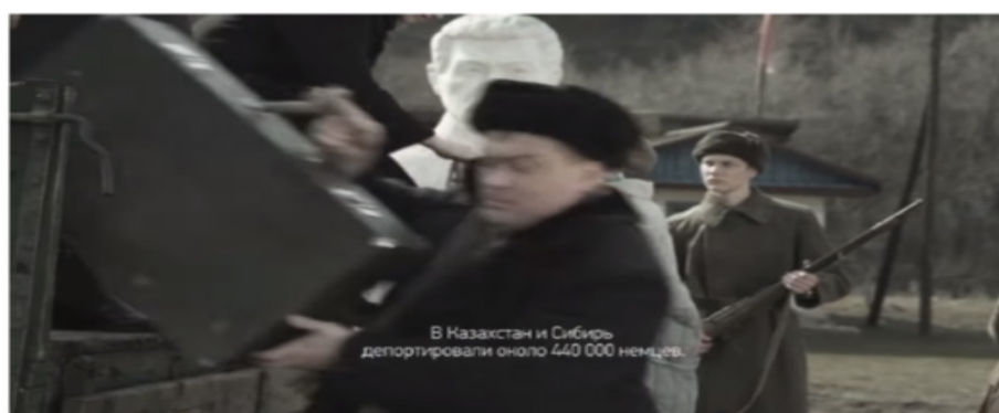
Рисунок 5 - Использование storytelling в социальной рекламе [11]

5. В Казахстане запущена социальная реклама под лозунгом «Одна страна. Один человек. Одна судьба». Первая серия проекта посвящена депортации немцев в бывшую советскую республику (в 1941 году власти СССР ликвидировали Волжскую Германскую республику и насильственно вывезли почти миллион этнических немцев, в том числе в Казахстан). В ролике казахи показаны как очень гостеприимные люди. Напротив, настоящие злодеи НКВД, которые сначала выполняют приказ о депортации, а затем - принудительно мобилизуют взрослых в трудовую армию и разлучают детей с родителями, выглядят настоящими злодеями. Как видите, здесь также использован Storytelling.